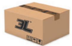
120 pares caja 120 pairs box